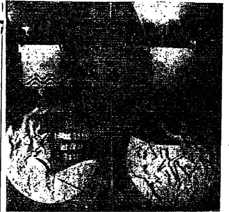
نولجان لوجهي المداينة الذهبية لاولياد المكسيك ١٩٦٨ الذي ينام في مدينة مكسيكو خلال الشهر القمام